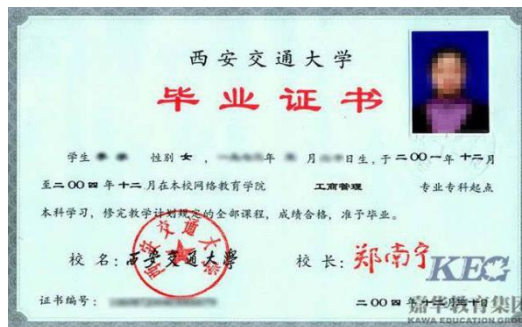
教育部学历证书电子注册备案表

八、往届毕业生须提供毕业证书照片和“中国高等教育学生信息网”的《教育部学历证书电子注册备案表》或《中国高等教育学历认证报告》，毕业证书丢失的提供毕业学校的相关证明材料。